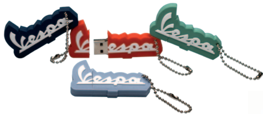
605301M002 (BLU / BLUE)