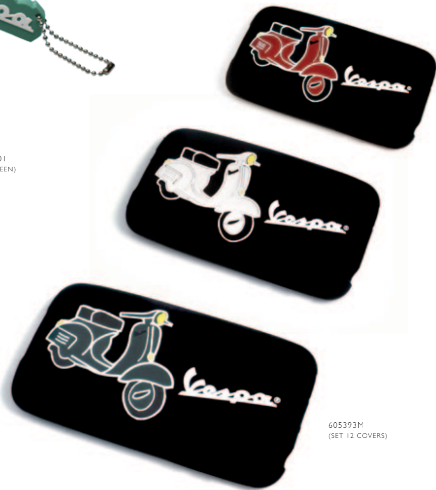
605393M (SET 12 COVERS)